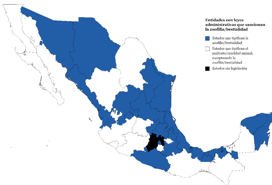
Figura 1. Mapa de las leyes estatales vigentes que tipifican la zoofilia/bestialidad.