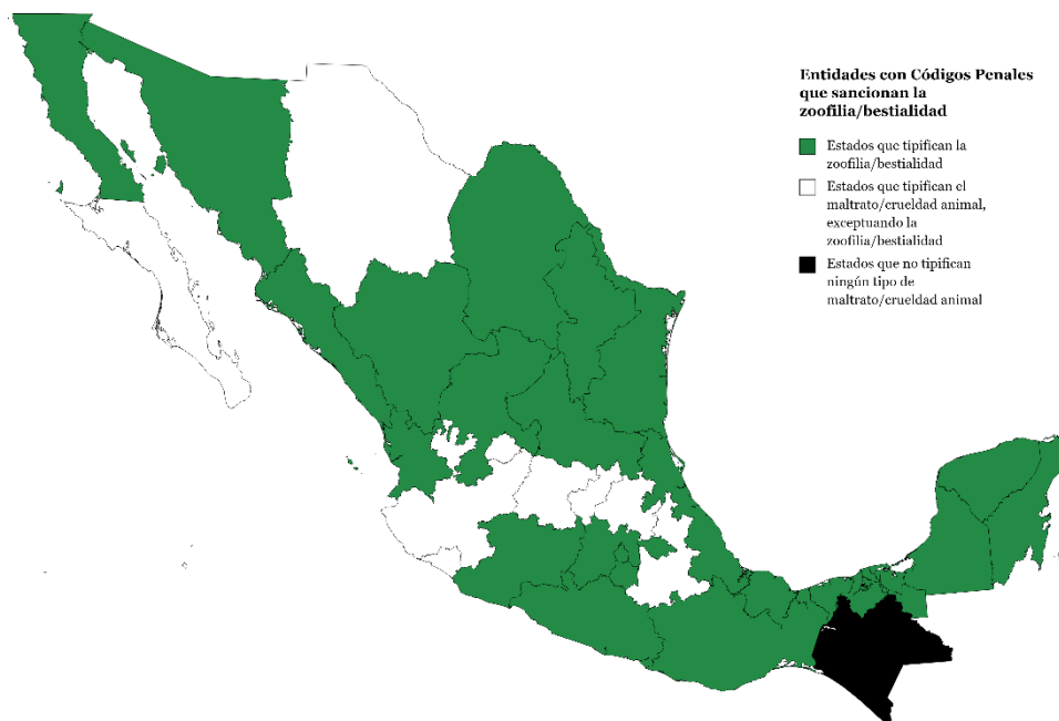
Figura 1. Mapa de los Códigos Penales Estatales vigentes que tipifican la zoofilia/bestialidad.