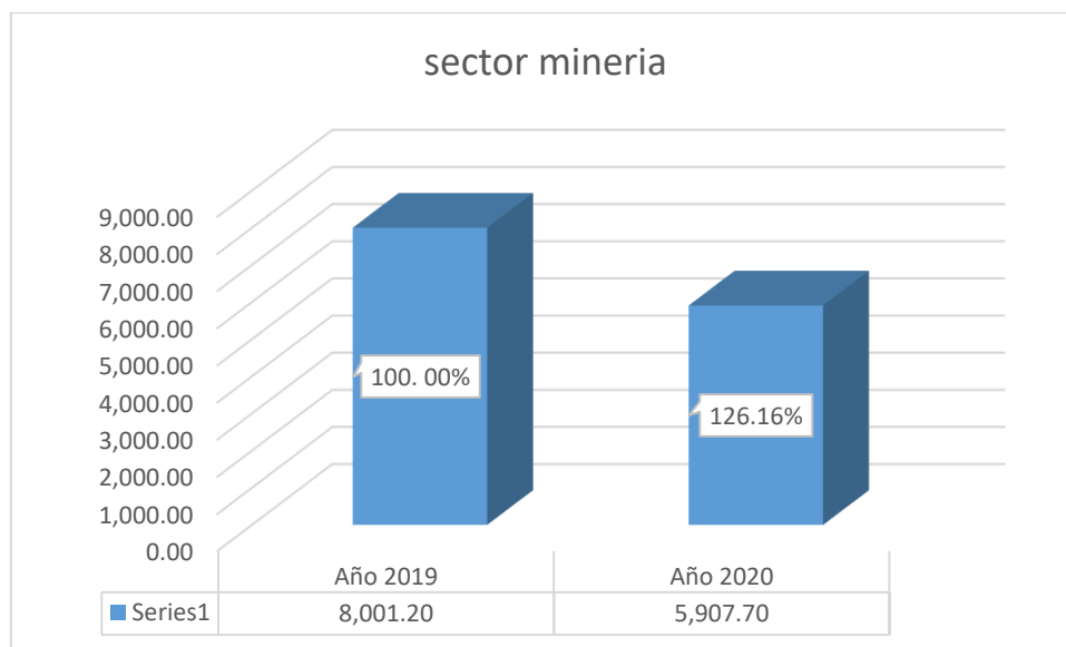
Figura 2: Comparación de la Recaudación Tributaria del Impuesto 2019 y 2020

El Análisis descriptivo de la variable muestra diferencias significativas respecto a la recaudación del Impuesto en la Actividad minera, tomando como base el Periodo 2019 el cual es un periodo ordinario sin pandemia, comparando los periodos tributarios de recaudación tributaria del año 2019 (Periodo normal) con el año 2020 (Periodo en pandemia), muestra una disminución de la recaudación en 2093.5 millones de soles, lo que significa que en periodo de pandemia el sector minería fue afectada por la paralización de la economía, aislamiento obligatorio y los gastos que ocasiona la pandemia, es así que la recaudación tributaria resultó muy afectada para el sector minería.